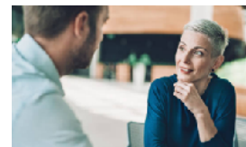
FEEDBACK REMOTE | FACE2FACE