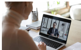
JOB-PERSON MATCH DIAGNOSTIK | INTERVIEW